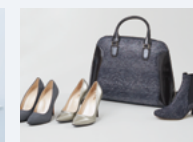
人工皮革〈クラリーノ〉